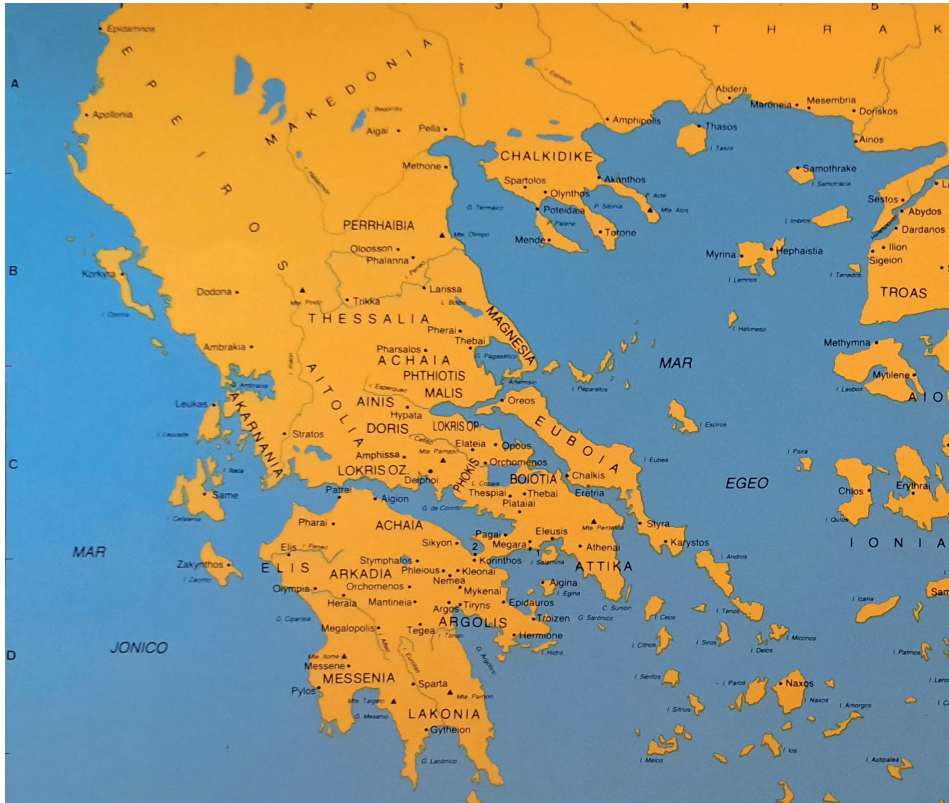
Figura 2. El mundo egeo en época clásica

monarcas persas apoyando, según les convenga, los intereses de las distintas ciudades-estado, coaliciones y ligas, así como la labilidad de algunos líderes helenos que sucumbirán a la codicia del oro del Gran Rey intentarán ser frenadas o camufladas desde la intelectualidad con la llamada a tópoi literarios tan reconocibles como la molicie, el lujo exótico y desmedido, o el mito del monarca déspota, arbitrario y dominado por “la política del harén” 12 . La activación de estos “mecanismos de defensa de lo griego” no interferirán, por otra parte, en el desarrollo de una lectura en positivo de ciertos monarcas aqueménidas, personalizaciones más o menos idealizadas de gobernantes equilibrados y justos que saben guiar con mano firme y que termina teniendo en Filipo II de Macedonia su parangón 13 .