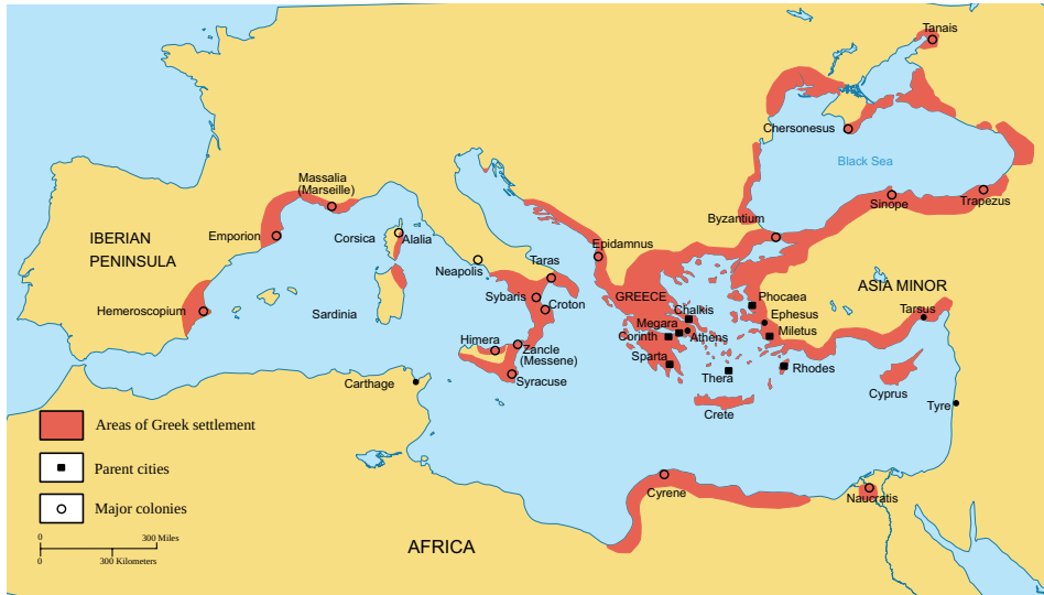
Figura 1. Territorios griegos y colonias. Periodo arcaico (750-550 a. C.)

por finiquitadas con la firma de la paz de Calias (448 a. C.) así como el periodo que se extiende desde la firma de la paz del Rey (386 a. C.) hasta la batalla de Queronea y el congreso de Corinto (338-337 a. C.) 8 se constituyen, igualmente, como dos puntos de inflexión fundamentales en la construcción, desde un punto de vista geográfico, pero, sobre todo, desde una perspectiva étnico-política, de los conceptos de Hellás y Héllenes 9 . Esta circunstancia no entra para nada en contradicción —y, para confirmarlo, basta con echar una ojeada a los acontecimientos político-militares que sacuden la Grecia continental durante los siglos V y IV— con las voces críticas con el ideal panhelénico que rezuman los discursos isocrateos y que no eran sino el reflejo de las ambiciones particulares de las distintas éthne y póleis 10 . El antídoto que se utilizará para que estas diferencias —cuando no el abierto enfrentamiento militar entre poblaciones heLENAS— no aboquen a la desaparición del peso específico de Grecia en el mundo mediterráneo será, de nuevo, la alteridad 11 . Las constantes intrusiones de los