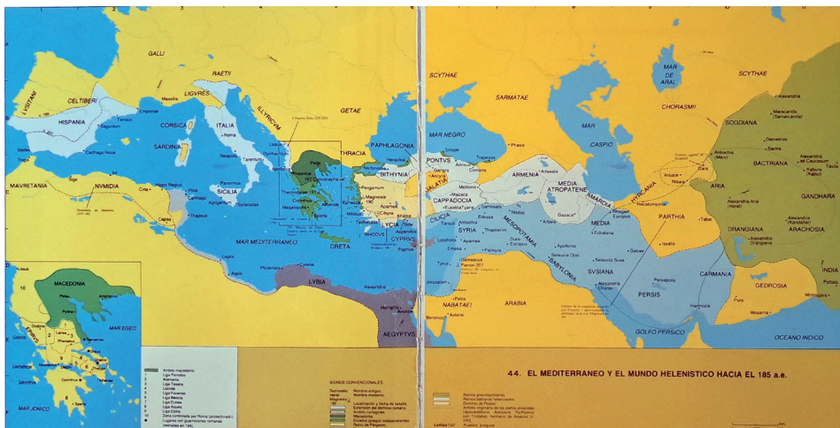
Figura 4. El Mediterráneo a inicios del siglo II a. C.