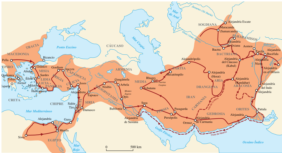
Figura 3. Máxima extensión del Imperio de Alejandro Magno, con hoja de ruta